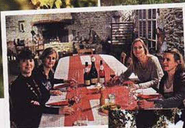
Le jury du «Vin des Femmes» au grand complet